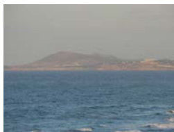
Fot. 2. Widok na Wyspy Liparyjskie w 2010 roku.