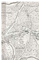
Ryc. 5. Użytkowanie ziemi w okolicach Chwaliszewa w XVII wieku.